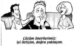
Cözüm önerilerimiz: iyi iletişim, doğru yaklaşım.

Motivasyonun sağlanmasında ailenin rolü genci anlamaktır ve bunu ona hissettirmektir. Örneğin; "Hem okulu hem de dershaneyi birlikte götürmenin zor ve yorucu olduğunu biliyorum ve bu zor dönemde senin yanındayım ve benden istediğin desteği vermeye hazırım." tarzında konuşmalar gencin motivasyonunu artıracaktır.